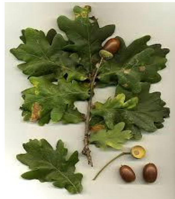
Дрво - даб